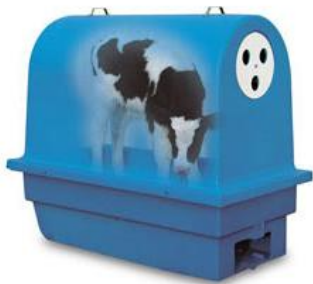
↑カーフウォーマー

産まれたての子牛は羊水で濡れています。直ちに乾かさないと低体温症を起こす恐れがあります。母牛に舐めさせる(リッキング)や、清潔なタオルで拭いてあげると、マッサージ効果で呼吸と排便が促進されます。また、カーフウォーマー(保温器)も近年販売されています。子牛を中に入ると温風により濡れた体を乾かしてくれます。この商品を真似て手作りした農家さんもいます。ぜひご検討ください。