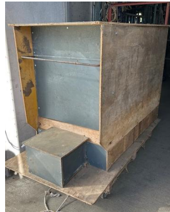
↑手作りの保温器です。